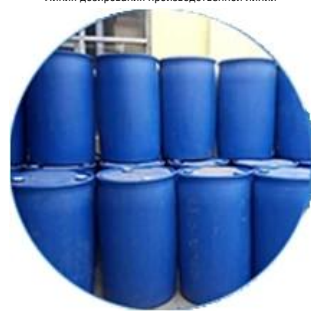
Реальный запас материалов