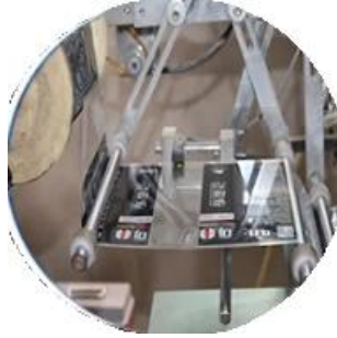
Машина с пленочным покрытием