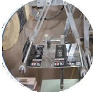
Машина с пленочным покрытием