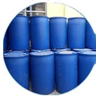
Реальный запас материалов