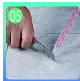
05 Наклонный нарезать верхнюю часть сопла в 45 °