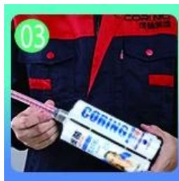
03 Открыть и смотрите, обе стороны могут быть изменены