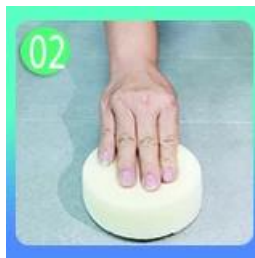
02 Польский с плиточным воском, кроме глазурированной плитки