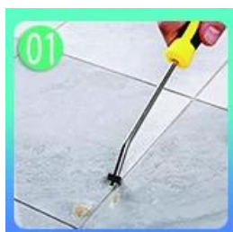
01 Очистите плитки и держите его сухими