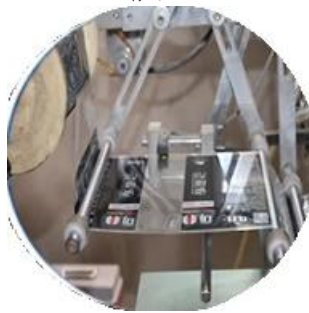
Машина с пленочным покрытием