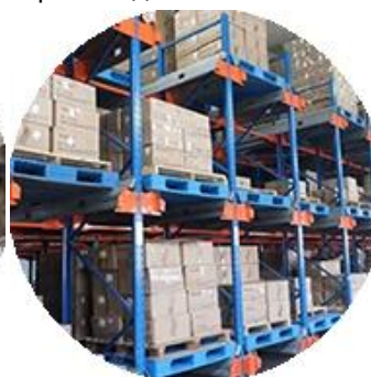
Реальный материал запаса