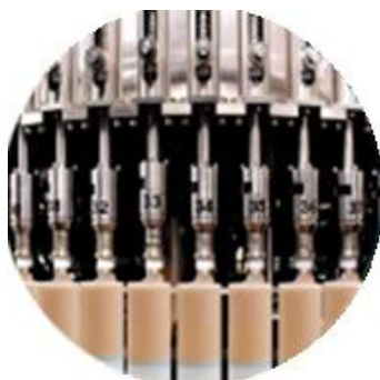
Наполнитель машинной линии