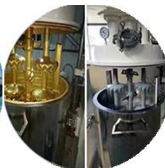
Дозировка производственной линии