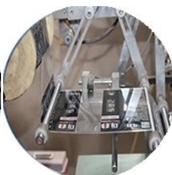
Машина с пленочным покрытием