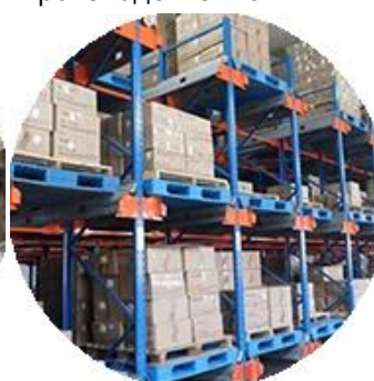
Реальный материал запаса