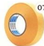
07 Masking Tape