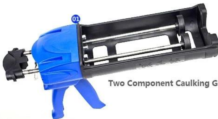
Two Component Caulking Gun