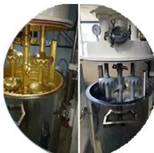
Дозировка производственной линии