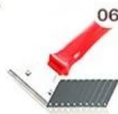
06 Perching Knife