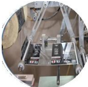
Машина с пленочным покрытием