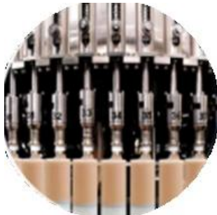
Наполнитель машинной линии