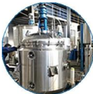
Сливочная линия машины