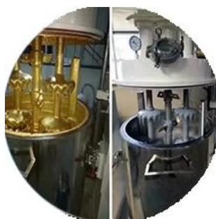
Дозировка производственной линии