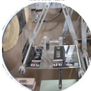
Машина с пленочным покрытием