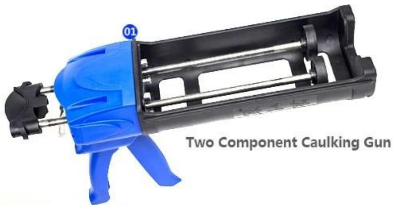
Two Component Caulking Gun