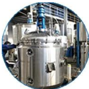
Линия для производства сливок