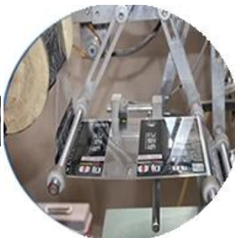
Машина с пленочным покрытием