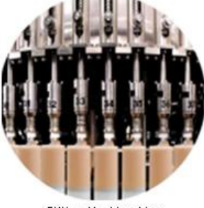
Filling Machine Line