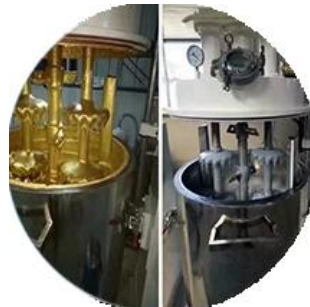
Дозировка производственной линии