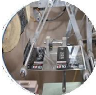
Машина с пленочным покрытием