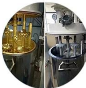
Batching Production Line