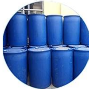
Real Material Stock