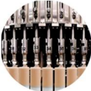
Filling Machine Line