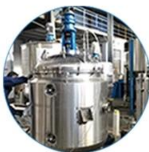
Creaming Machine Line