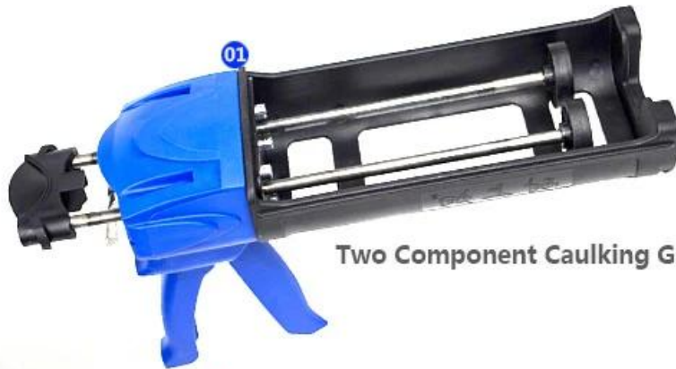
Two Component Caulking Gun